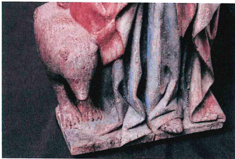
Vue de détail de la base